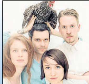
Schneeweiss & Rosenrot

20 Uhr, Theaterstübchen, Jordanstraße 11: Konzert des preisgekrönten Jazzquartetts Schneeweiss & Rosenrot. Vorverkauf: 15 Euro, Abendkasse 17 Euro.